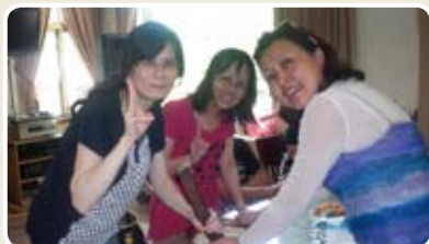
▲會員及眷屬藉此難得機會好好聯誼