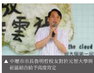
▲中壢市市長魯明哲校友對於元智大學與社區結合給予高度肯定

元智大學藝術與設計系學生發起「把頭放進雲裡」計畫，到桃園縣中壢市內壢里，改造老舊社區