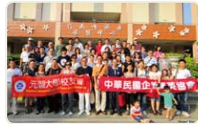
▲大夥快樂合影，留下令人回味流連的鏡頭