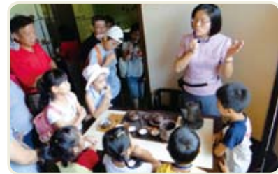
▲台灣茶葉發展史解說，連小朋友都聽得入神