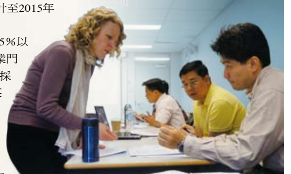
▲全球排名第45，全球21所優秀的研究型大學Universitas 21的成員之UNSW教師群為元智特別量身打造二週Faculty Development Program