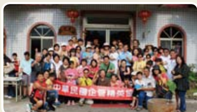
▲大夥快樂合影，留下令人回味流連的鏡頭