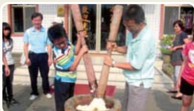
▲客家麻糬DIY，需要父子齊心協力一起來