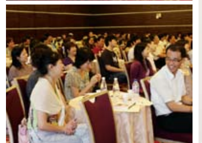
▲ 透過「元智密碼」名人對談——走進高等教育的桃花源，探討提升大學生競爭力，分享元智關鍵密碼