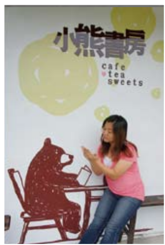
▲ 2011.09.07 Lake Plum at I-Lan, Taiwan