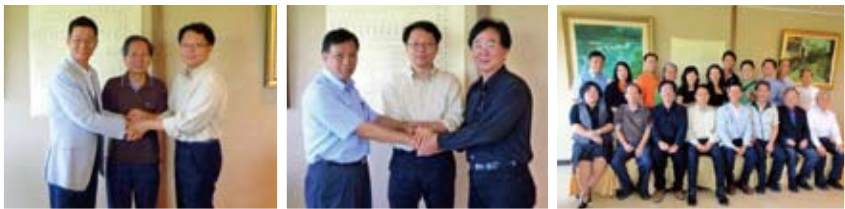
▲企管菁英協會理事長順利傳承交接 ▲秘書長交接 ▲企管菁英協會第六屆新當選理監事及幹部會後合影