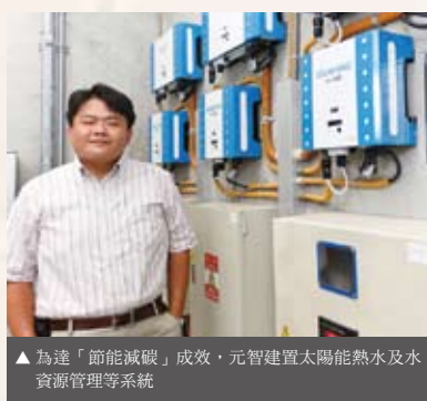
▲為達「節能減碳」成效，元智建置太陽能熱水及水資源管理等系統