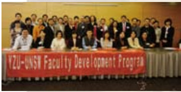
YZU-UNSW Faculty Development Program

對於師資要求新聘的教師要能通過英語教學面試才獲聘任，元智更提供優渥的薪資、更好的教學研究環境、更寬廣的發展空間。為求英語教學的精準，元智也同步要求校內老師進修，自2010年暑假起連續五年，每年約送25名教師前往澳洲新南威爾斯大學（UNSW）海外研修，預計5年約1/3教師接受過海外研習，讓元智英語教學更上層樓。