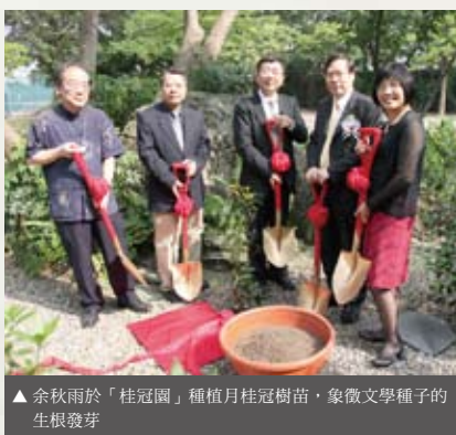
▲ 余秋雨於「桂冠園」種植月桂冠樹苗，象徵文學種子的生根發芽

元智大學為倡導青年學子對文學的關注，提升人文素養及文學閱讀風氣，從2006年起設置「元智大學桂冠文學家」獎項，在各文學領域，包括小說、散文、戲劇等項目中，選出對台灣社會有長期影響之人士，包含文學大師陳之藩、白先勇、鄭愁予與高行健等人都獲頒贈此榮譽獎座。