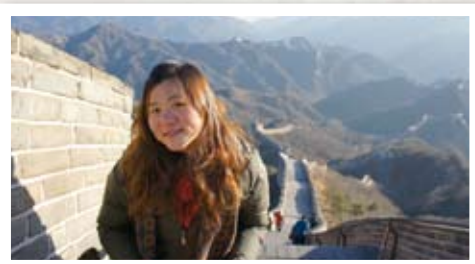
▲ 2011.01.01 Great Wall at Beijing, China

不過我得先坦白，在大學時期，我最愧對的是傳道授業的教授們。因為我總是把學業排在課外活動以後的順位，以為時間充裕，就可以在白天配合課外活動，晚上才挑燈夜戰、補足課業上的進度。沒能按時溫習課業，又不停地挑戰自己的身體極限，是日後「時間管理」和「健康管理」的警訊。