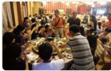
▲英吉利海鮮餐廳理事長與校友話聯誼同享海鮮大餐