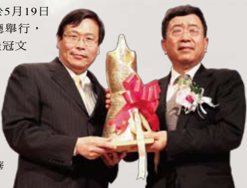
▲ 余秋雨先生 (右) 獲頒第五屆桂冠文學獎獎座

獎項設立至今已邁入第5屆，今 (2011) 年將此殊榮頒給余秋雨先生，除了表彰他對近代文學的深遠影響，也肯定其在全球華文界的卓越貢獻。桂冠文學獎頒獎典禮於5月19日在元智大學有庠廳舉行，典禮當天除了有桂冠文學家頒贈儀式、元智「桂冠園」種植月桂冠樹苗之外，余秋雨也於典禮中發表專題演講——「空間與時間意義上的中華文化」。