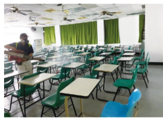
▲教室環境消毒清潔