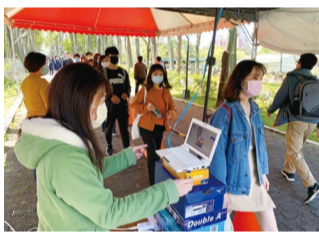
▲入校者全面實施體溫量測

疫情持續延燒造成大家生活不便，更重創許多產業與經濟，在疫情警報尚未解除前，提醒您配合政府防疫，務必落實手部衛生、咳嗽禮節及佩戴口罩等個人防護措施，盡量居家辦公，減少不必要移動、活動或集會，避免群聚及出入人多擁擠的場所，如有外出應配合實聯制登記與人潮分流規定，並主動積極配合各項防疫措施，減少病毒傳播機率並阻斷社區傳播鏈，共同攜手度過疫情挑戰。