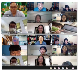
▲啟動線上遠距教學措施