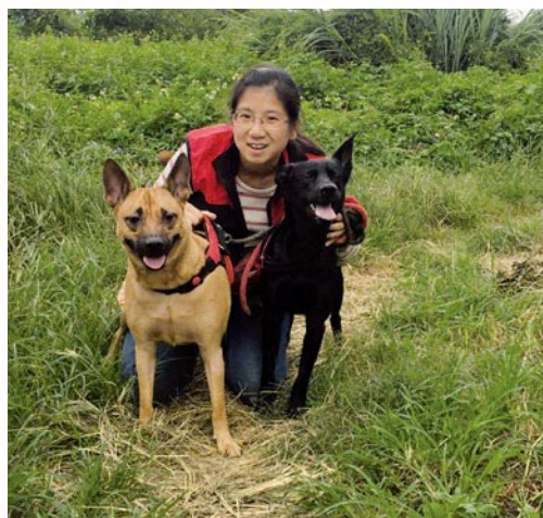
中國語文學系碩士班 107級 莊同學

能受領獎學金對我來說是一場及時雨，讓我的經濟暫時得到舒緩，離家相隔七百公里的我，不再徬徨，可以安心求學。我想和蔡幸真學姊說聲感謝，即便沒有和學姊接觸過，她協助家裡經濟有困難、家庭突遇變故的學生，能夠穩定心情，順利完成學業。我努力扮演好學生的角色，感謝來陪我度過難關的師長、獎學金的捐贈人士。我在求學上的不鬆懈，有好的成績表現。目前規劃申請元智大學的五年一貫，期望能順利完成碩士課程，畢業後，能在台灣找工作繼而定居，回饋台灣這片土地。