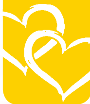
管理學院學士班 107級 湛同學

生命之所以美麗可貴 是因為人與人的相遇及相助 各界的協助就像黑暗中的燈塔 點亮前行者的光亮