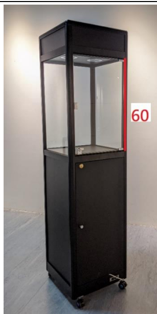
8、玻璃金屬展示櫃-黑 (180cm*45cm*45cm)