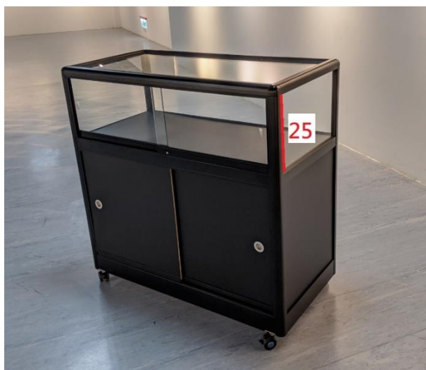
7、玻璃金屬展示櫃-黑 (100cm*100cm*50cm)