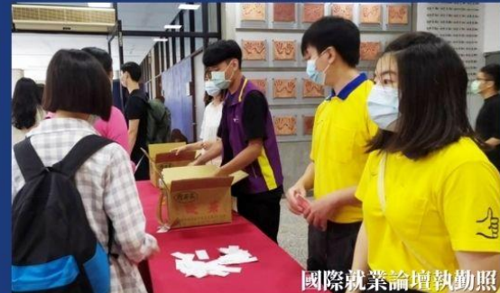
國際就業論壇執勤照