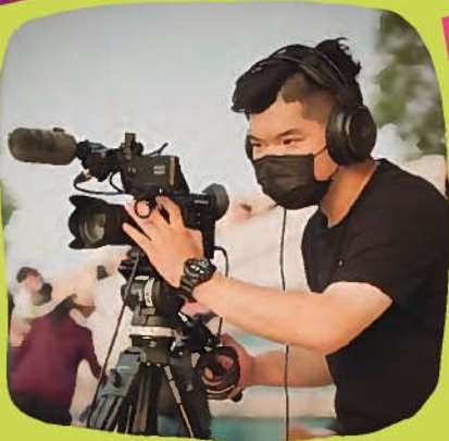
國立屏東大學 愛拍社現任社長