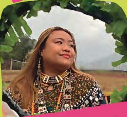
國立屏東大學 原住民族文化傳承社前社長