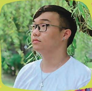
國立屏東大學 第六屆學生會會長