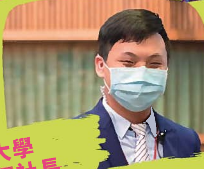
NPTUer學生活動整合平臺 開發創建學生負責人