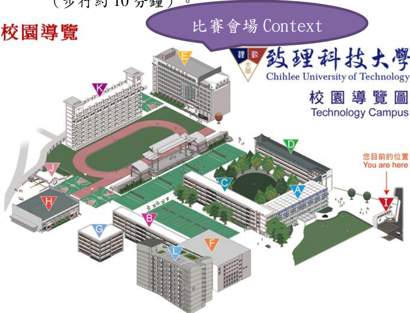
圖 1 校園導覽圖