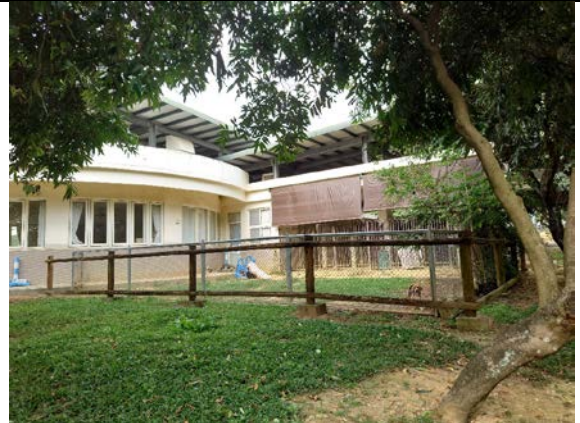
狗狗散放草地外觀