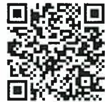
報名表 QR Code