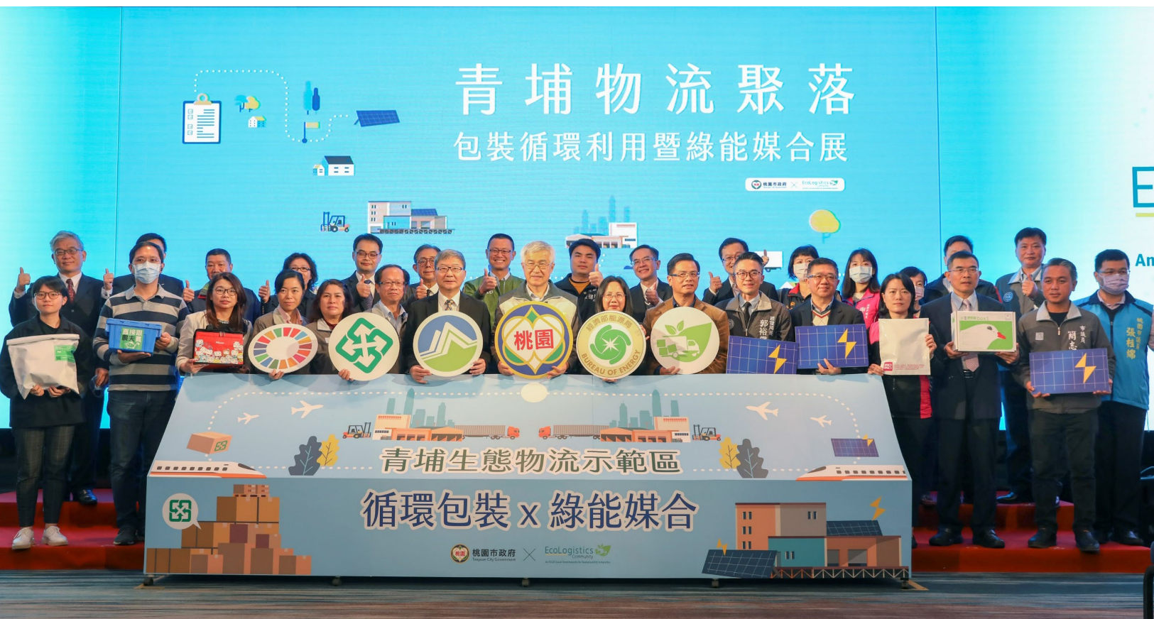
青埔物流聚落—包裝循環利用暨綠能媒合展