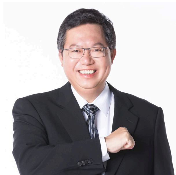
主席 鄭文燦 市長