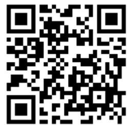
活動報名 QR 碼

如有報名及活動相關問題，請逕洽北區自主互助聯盟張庭瑋先生，電話：02-24622192 分機 1253。